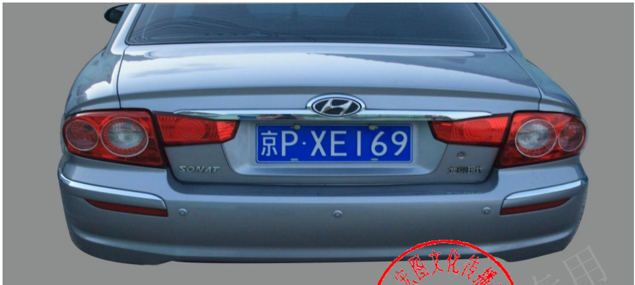
本项目商务保障车辆【图-3】